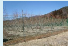
防除柵を設置したMさん

☆お問い合わせ先…下諏訪町役場 産業振興課 農林係(2階) 電話 27-1111(内線277・278)